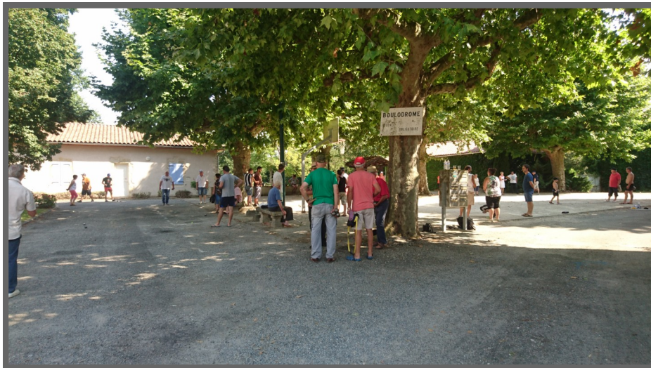
Concours de pétanque pendant la fête locale 2019

Henry BEYT président de la Pétanque Ananaise