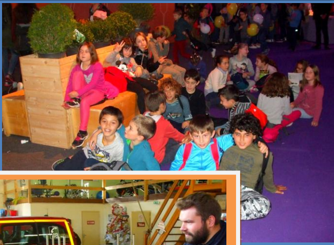
Au parc des expositions de Toulouse...