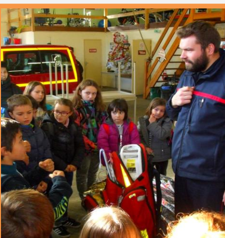
Visite de la caserne des pompiers de L'Isle en Dodon